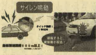
↑事故現場検証中の事故を防ぐ「衝突車両検知通報システム」